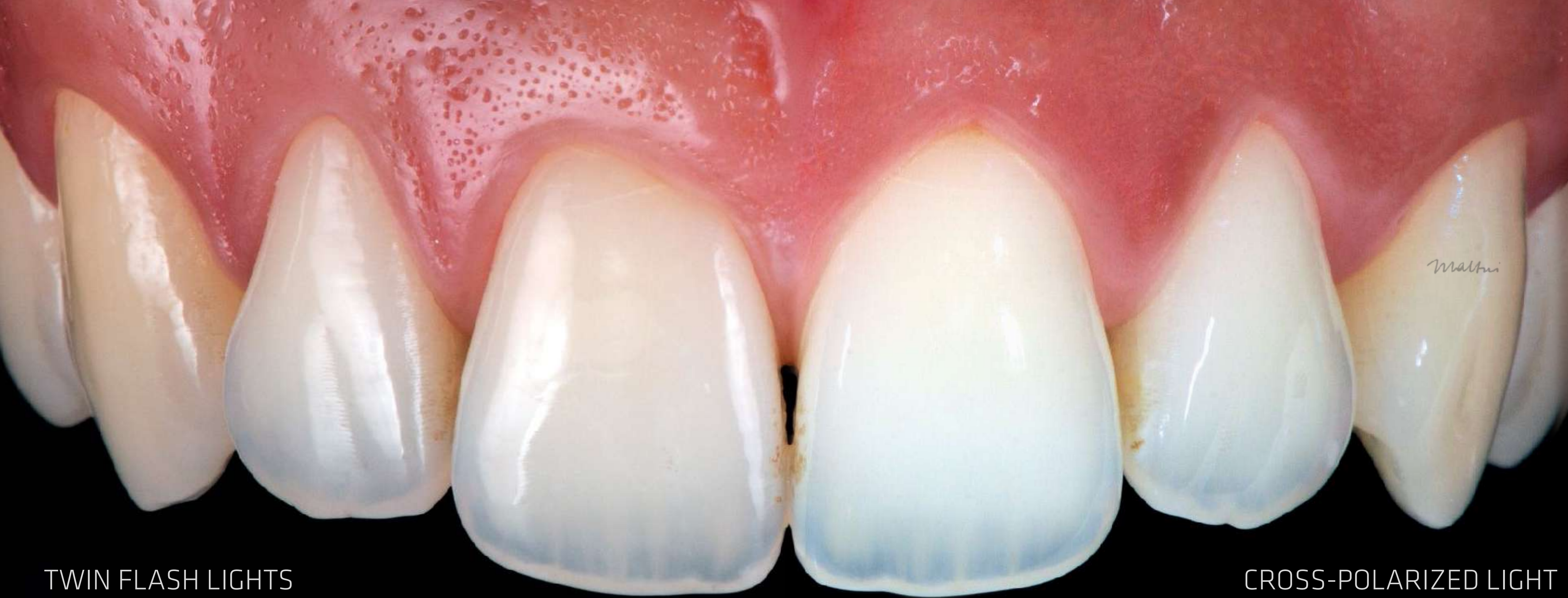
TWIN FLASH LIGHTS